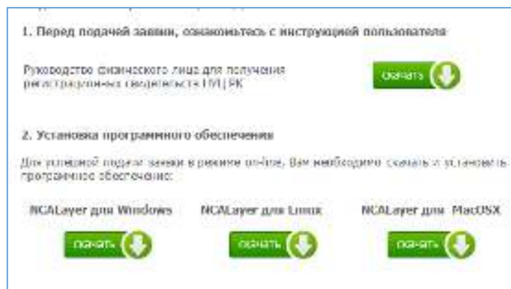
2-сурет. NCALayer бағдарламалық жасақтамасын жүктеу

3.3. NCALayer бағдарламалық жасақтамасын орнатуға қатысты сұрақтар туындаған жағдайда, 1414 нөмірі бойынша ҚР ҰКО Қолдау қызметіне қоңырау шалуды немесе support@pki.gov.kz электрондық поштасына хат жолдауды өтінеміз.